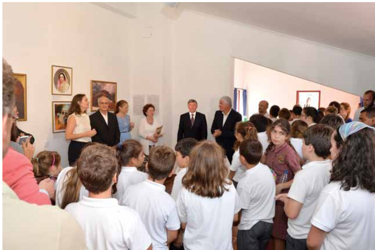
Открытие Кабинета имени Карла Брюллова в Многоязычной школе на Мадейре, г. Фуншал, 30 сентября 2014 года