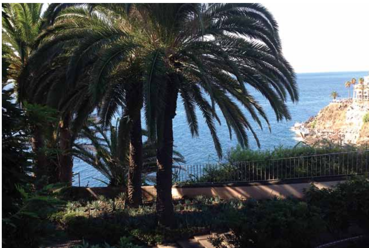
Береговая линия Фуншала – столицы острова Мадейра. 2014 год