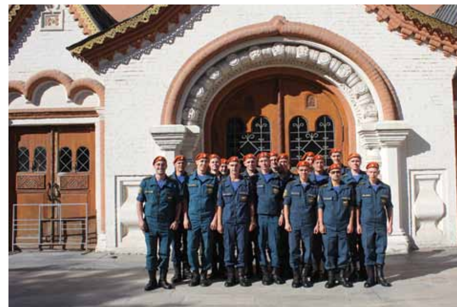
Экскурсии по Третьяковской галерее для личного состава МЧС России. 2014 год