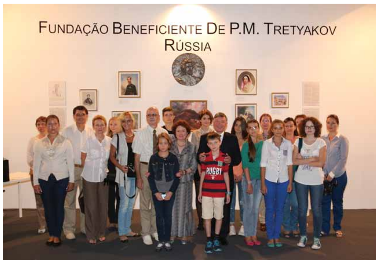
Экспозиция Фонда на Международном фестивале изобразительных искусств «Вера». После занятия с учениками и преподавателями средней школы при посольстве России в Португалии. 19 сентября 2014 года