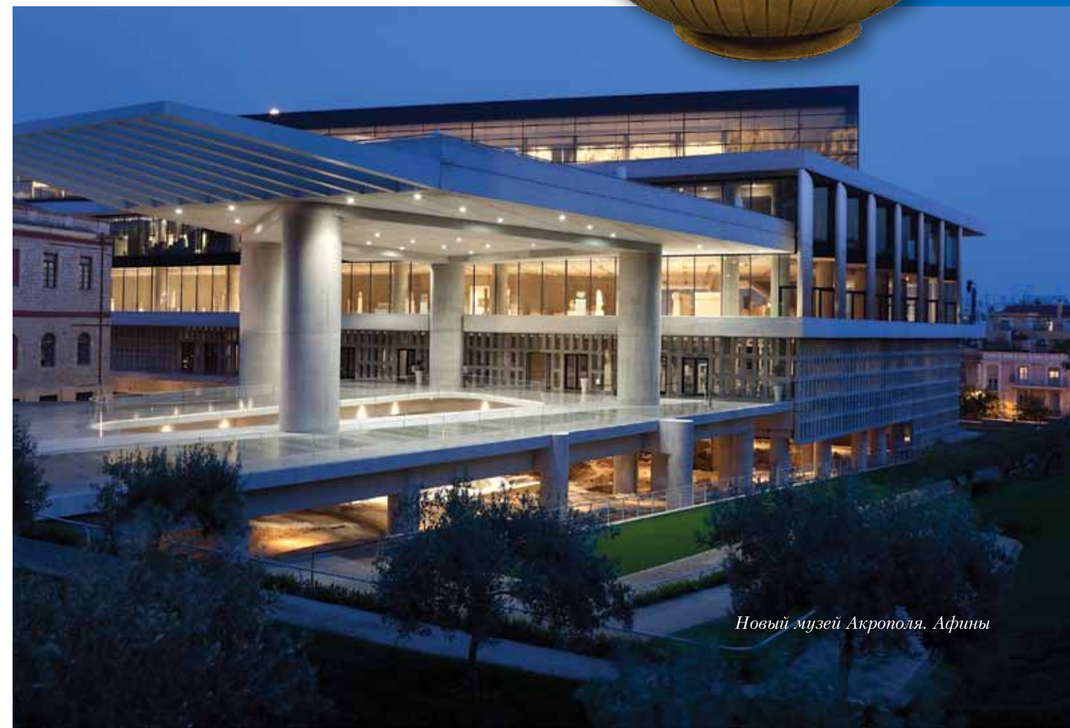
Новый музей Акрополя. Афины