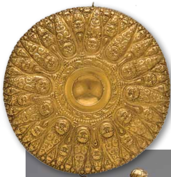
Фиала. Греческая работа. IV в. до н. э. Золото. Высота 2,5 см; диаметр 23 см