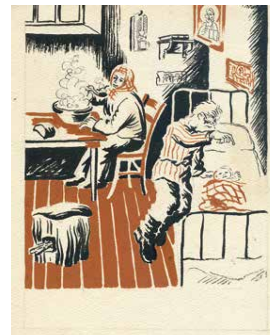
Ю.Н. Рейтлингер. Иллюстрация к рассказу Л.Н. Толстого «Где любовь, там и Бог». Бумага, тушь. 17x13,5. Дом русского зарубежья имени Александра Солженицына. Москва