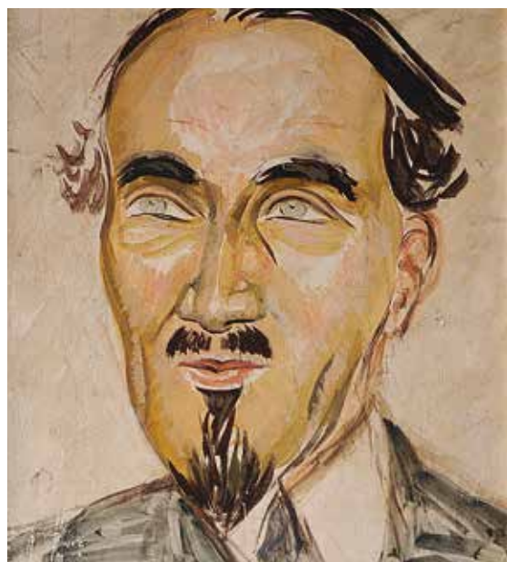
Ю.Н. Рейтлингер. Портрет Г.П. Федотова. Париж. 1930-е годы. Фанера, темпера, гуашь. 27,4x23,7. Дом русского зарубежья имени Александра Солженицына. Москва. Публикуется впервые

Фрагмент постоянной экспозиции Музея русского зарубежья «Юлия Николаевна Рейтлингер». Дом русского зарубежья имени Александра Солженицына. Москва