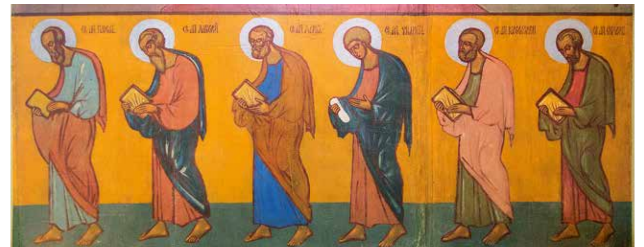
Ю.Н. Рейтлингер. Сошествие Святого Духа на апостолов. 1931–1932. Фанера, темпера. 247,9x99 Шествие апостолов. 1931–1932. Фанера, темпера. 243,5x100 Дом русского зарубежья имени Александра Солженицына. Москва